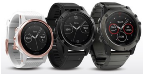
FENIX 5S | FENIX 5 | FENIX 5X